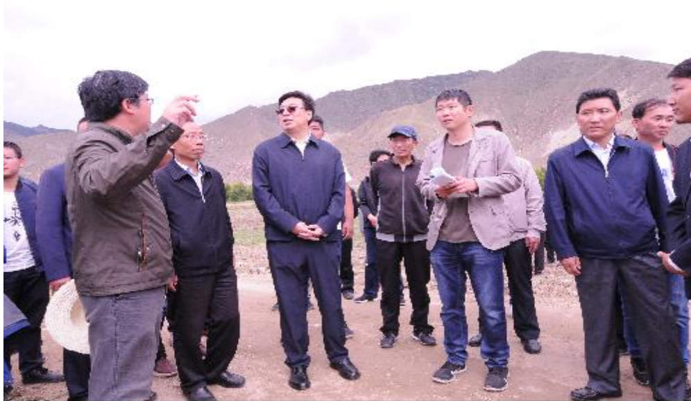
与农业农村厅领导一起向自治区党委书记吴英杰

为宣传示范内地高效先进农业机械，做好全程机械化试验示范工作，提高农牧民全程机械化生产意识，钟成义以农业农村部“农业技术示范与服务支持项目”为依托，克服重重困难，先后在拉萨市曲水县和林周县、山南市乃东区、日喀则市南木林县建立了4个青稞和牧草全程机械化示范基地。多次在农业农村厅领导的统一安排下牵头组织开展全程机械化试验示范工作，包括本文开始提到的自治区党委书记吴英杰亲自参加的全程机械化示范现场会。